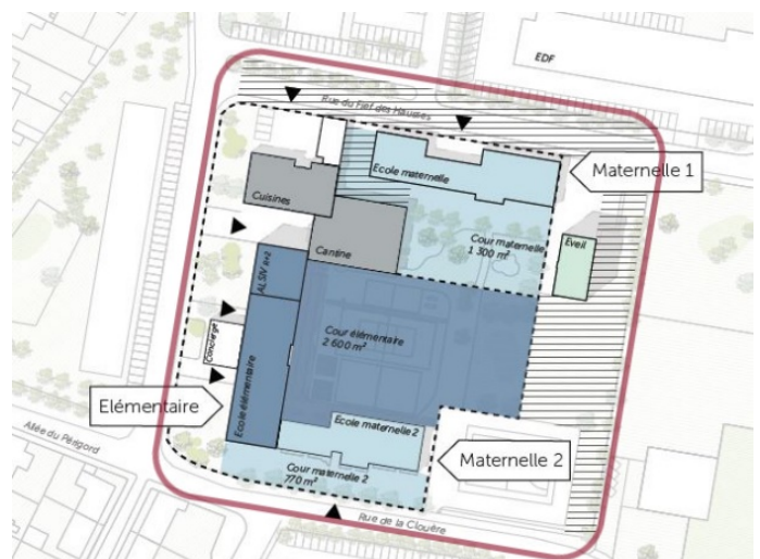
Répartition des programmes (état existant) - LAMBERT LENACK

La rénovation du groupe scolaire occupe une place centrale : à la fois stratégique, dans le programme de renouvellement urbain ; spatiale, au sein du quartier des Couronneries ; et symbolique, en termes de réussite éducative et de mixité sociale.